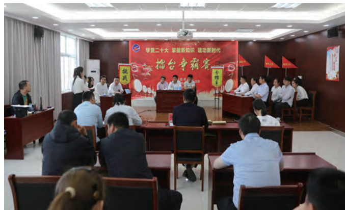
近日,青口投资公司相继举办“学贯二十大·掌握新知识·建功新时代”擂台争霸赛和“学贯二十大·感悟新思想”书记讲坛,进一步激发广大职工学习新精神、领悟新思想、储备新知识的激情动力。(卢忠歌 仲伟彬)