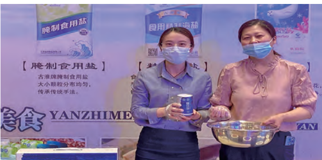
5月13日,金桥制盐公司参加2023“味道连云港”海鲜美食大赛,在地方特产展位推介公司各类食盐产品,并现场演示凉拌食用盐食用方法,直观展示其“纯净、味鲜、易融”等特性,受到一致称赞。同时进一步了解了市场需求,为公司新品研发及营销策略制定提供参考。(季士杰)