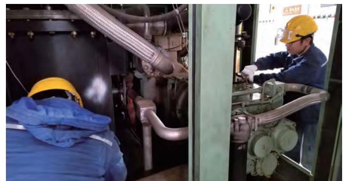
今年以来,利海化工公司狠抓节能降耗,开展各类技术攻关活动,推进挖潜增效,5月份,组织精干力量完成了1台进口螺杆空压机电机改造,年节约电费5万元/台,减少维护费用1.5万元。下一步,将对另外2台进口螺杆空压机电机进行改造,降低运行能耗及维护费用。(郁洪兵 刘军明)

▲5月18日,青口投资公司海州区盐田玉粮油直营店开业,进一步升级扩大“盐田玉”产品销售终端。(青宣)