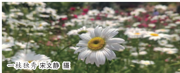
一枝独秀