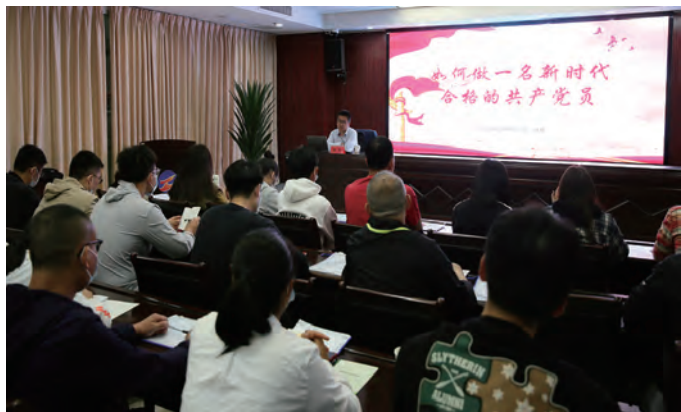
为进一步规范党员发展工作,5月18日,集团公司党委分三个片区举办为期三天的党员发展对象培训班,来自各单位的79名党员发展对象参加培训。(工宣)