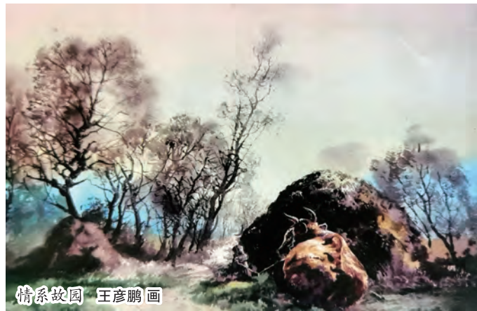
情系故园 王彦鹏画

我爱月季花，不仅它香气沁人心脾，更是在默默绽放着永恒，岁月静好中保持长青。暮色将至，让花香更浓郁了几分，如春风般萦绕着大地……让我们沉醉在花海中久久不能忘怀，感叹它那美妙、神奇。