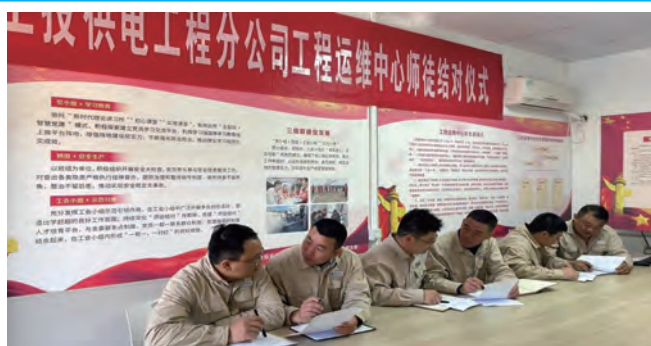
为加强人才队伍建设,充分发挥技术骨干“传帮带”作用,近日,供电工程分公司工程运维中心开展“师徒结对”活动,进一步促进新员工技能水平和综合素质快速提升。(王梦洁)